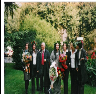
Foto random Laurea

Per la libertà della ricerca scientifica